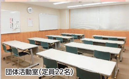
団体活動室(定員22名)