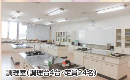
調理室(調理台4台・定員24名)