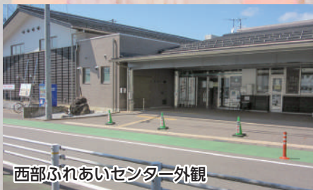
西部ふれあいセンター外観