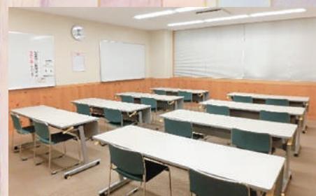
団体活動室(定員22名)