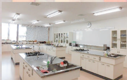
調理室(調理台4台・定員24名)