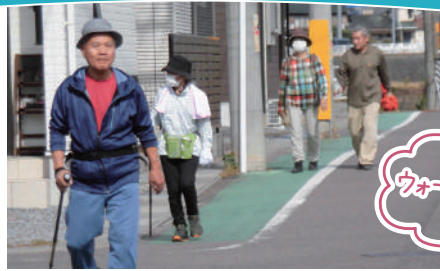
ウォーキング大会