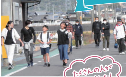
たくさんの方が 来られました!