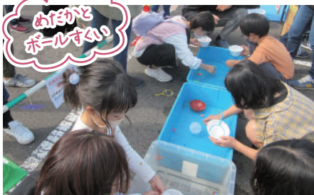
おぼろ ボールすくい