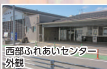
西部ふれあいセンター 外観