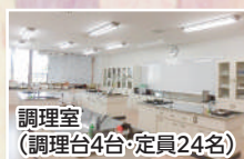
調理室 （調理台4台・定員24名）