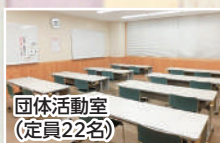
団体活動室 （定員22名）